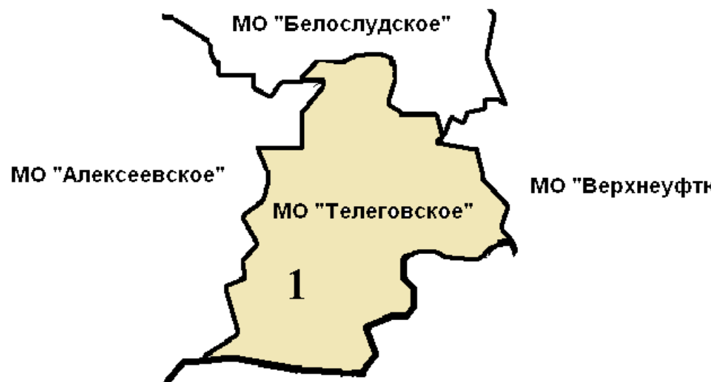
СХЕМА ИЗБИРАТЕЛЬНЫХ ОКРУГОВ ПО ВЫБОРАМ ДЕПУТАТОВ ПРЕДСТАВИТЕЛЬНОГО ОРГАНА МУНИЦИПАЛЬНОГО ОБРАЗОВАНИЯ «ТЕЛЕГОВСКОЕ» НА 2016-2025 ГОДЫ

Общая численность избирателей, зарегистрированных на территории муниципального образования «Телеговское» по состоянию на 01.01.2016 г. составляет 1222 человек.