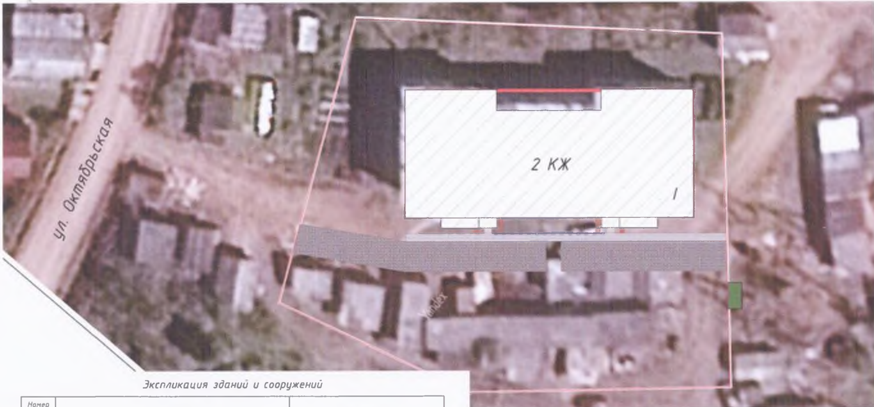
Экспликация зданий и сооружений